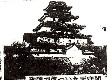
砲弾で傷ついた天守閣