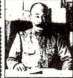
小田山から攻撃する西軍 松江所長