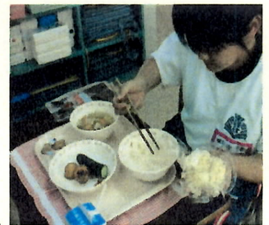
(真剣におにぎりを作ります。)